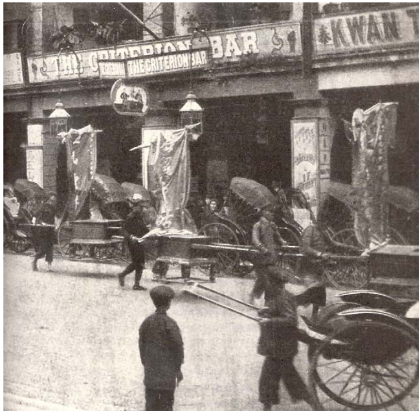
1912 年農曆新年期間一隊前往附近廟宇（很可能是

簡介： 自 1872 年建成以來，東華醫院歷屆總理的工作，對區內施善教化的影響都很大，自是當之無愧的社會領袖。若單從這個角度去論說本章的內容，很容易變成一篇流水帳，淡而無味，不免可惜。這裡準備把東華領袖放在一個比較闊大的框架之內，看看他們何回應國家民族和香港的呼喚，如何在歷史中掙扎求存，在時代裡尋找出路，和從相關的互動中拾取到多少的成功與失敗。