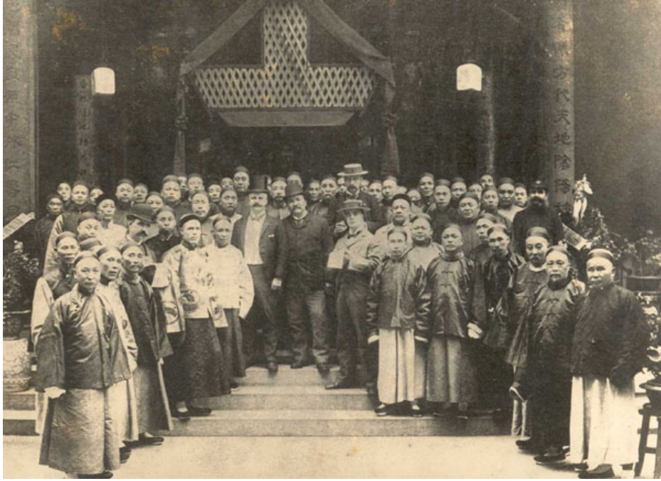
1900年東華新院暨保良局開幕，何啓（中央）、輔政司駱克與其他官紳合照。

文武廟)的酬神行列路過皇后大道中。4個月前爆發的辛亥革命雖為香港帶來動盪，不過卻沒有造成持久的混亂。