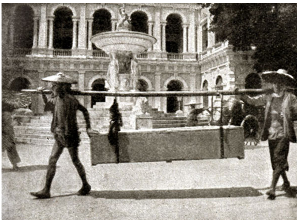
1901 年兩名件工從街上運走一具華人屍體，背景為舊大會堂。