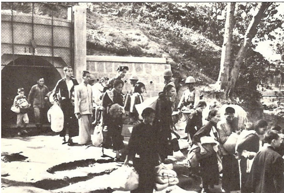
1941 年 12 月底香港淪陷，居民在日軍監視下走出防空洞。

同年 12 月 25 日下午灣仔峽亦告陷落，日軍進入中環之路已無阻擋。迫於形勢，港督楊慕琦（Sir Mark Young）遂向日軍當局投降，香港正式進入日佔時期。與香港苦難同當的東華醫院，亦踏入了一個艱難險阻、掙扎求存的困局。