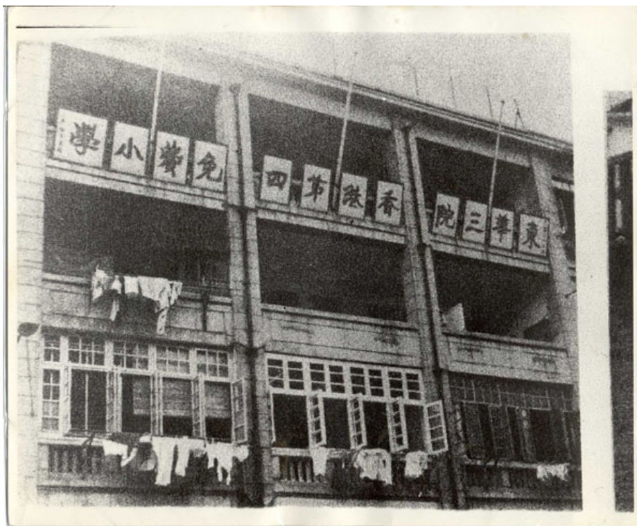
位於駱克道的東華三院香港第四免費小學。