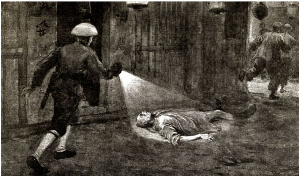
1901 年英國一份期刊插圖，描述一名剛去世的華人被棄置港島的街頭。

簡介： 自東華醫院於 1872 年 2 月啓用後，由於其創辦目的不僅是贈醫施藥，更兼顧身後無以殮葬的華人，所以自設立不久，即為有需要的貧苦無依居民安排最後歸宿。長期以來，這一項工作更是該院繼醫療之後開支最大的一項服務，以貫徹東華醫院「生有所安，死有所托」的宗旨。除為本地貧困居民提供免費殮葬外，東華醫院從 19 世紀起即為海外華人特設原籍安葬，這項可說是獨樹一幟的服務，使東華醫院由一地區性之慈善組織提升至具有國際聲望的機構，更奠定其在海外華人社團中崇高的地位。