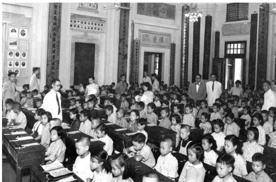
1948 年東華三院義學學生在東華醫院大堂聯考。

簡介： 東華義學始於 1880 年，以傳統學塾為模式，教授中國傳統經典。1880 至 1959 年間，東華義學由一所擴展至二十一所，淪陷時全部義學停課。戰後五所義學復校，1950 年代註冊為政府津貼學校，成為五所規格完備的標準小學。1920 至 1930 年代東華逐步改革義學，邁向現代學校模式，戰後更發展為規格完備的小學。到 1963 年正式啓用第一所中學後，東華便完成建設完整連貫的基礎教育這個多年抱負。整個義學變革過程，交織著東華辦學的努力、香港教育政策的演變和中國政局的影響。回顧香港的教育史，義學應被視為香港正規教育歷史的一環，從東華義學的經驗，更可看到民間辦學的一個側面。