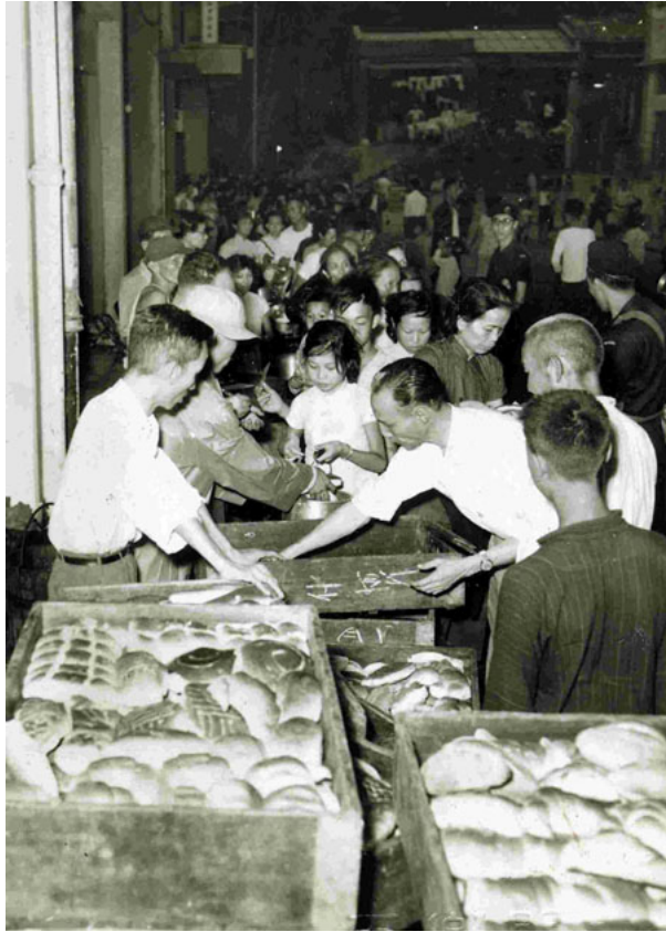
1960年一次風災過後，東華三院隨即安排派發食物給災民。