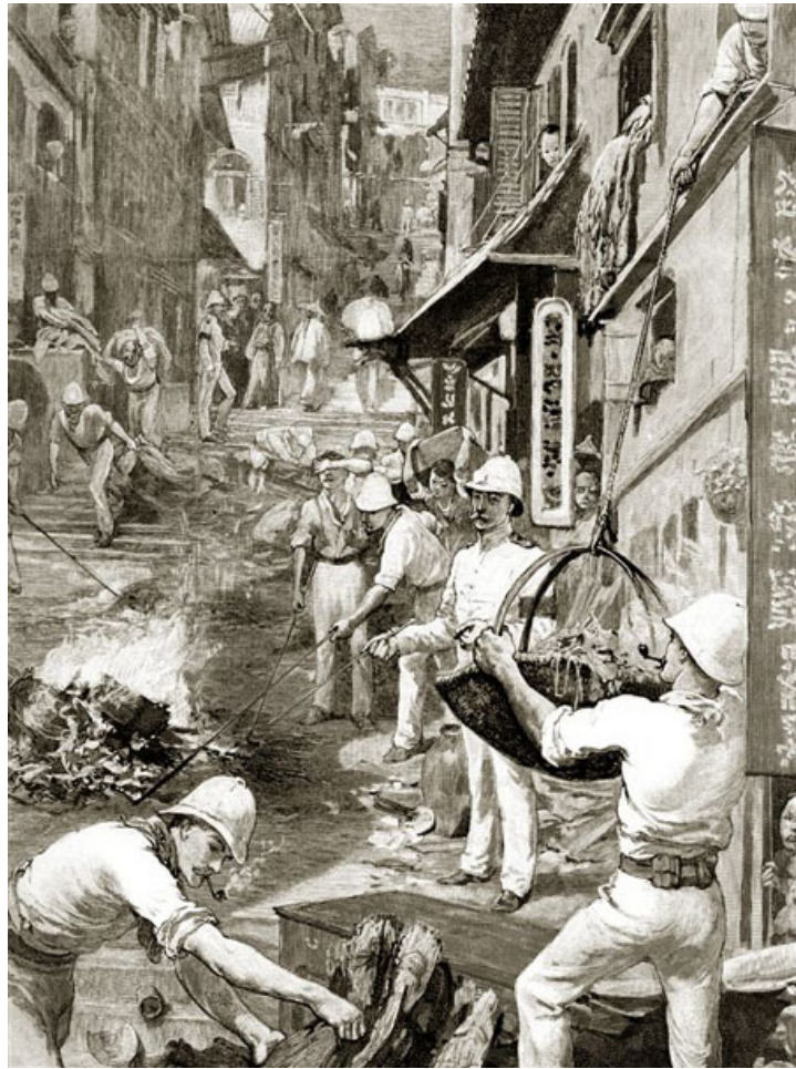
英軍在疫區協助潔淨消毒。