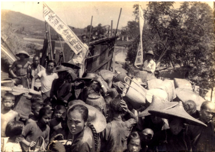
1948年三水地區發生水災，東華三院隨即委托該地同鄉會分發物品賑濟災民。