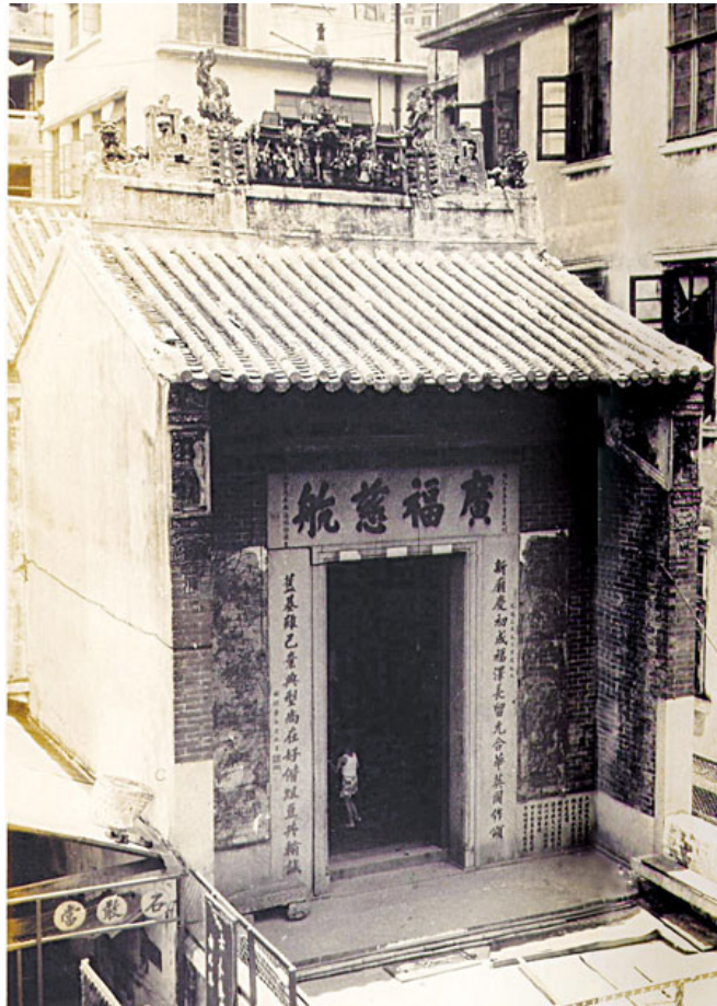
廣福義祠，攝於 1960 年代。