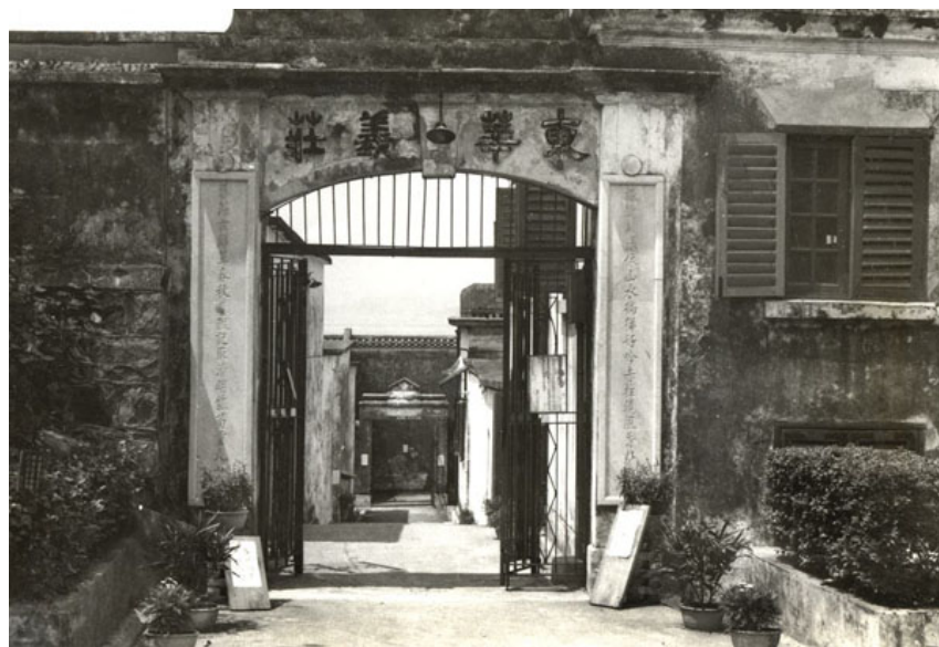
位於大口環的東華義莊。