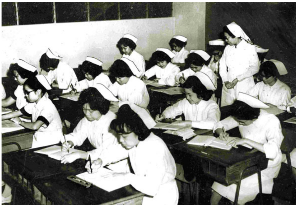
1960年代在課堂學習的護士學生。

簡介： 在中國人心目中，照料病人是奴僕的工作，而且由女看護照顧男病人，更非中國傳統所能容許。因此，合格護士人手不足、社會觀念對護理的鄙視和性別傳統的限制等，都是早年護理本地化舉步為艱的原因。1920年代，東華醫院的西醫已發展到一定程度，而受訓護士的需求自然不在話下，因此1927年東華醫院開辦護士訓練課程，其後廣華醫院及東華東院也分別開辦護士學校，以中文教學，訓練本地華人學生，一方面令醫院服務進一步西化，同時又促進了香港護士專業本地化。本章以東華三院開辦的護士學校探討護士行業在香港的發展。