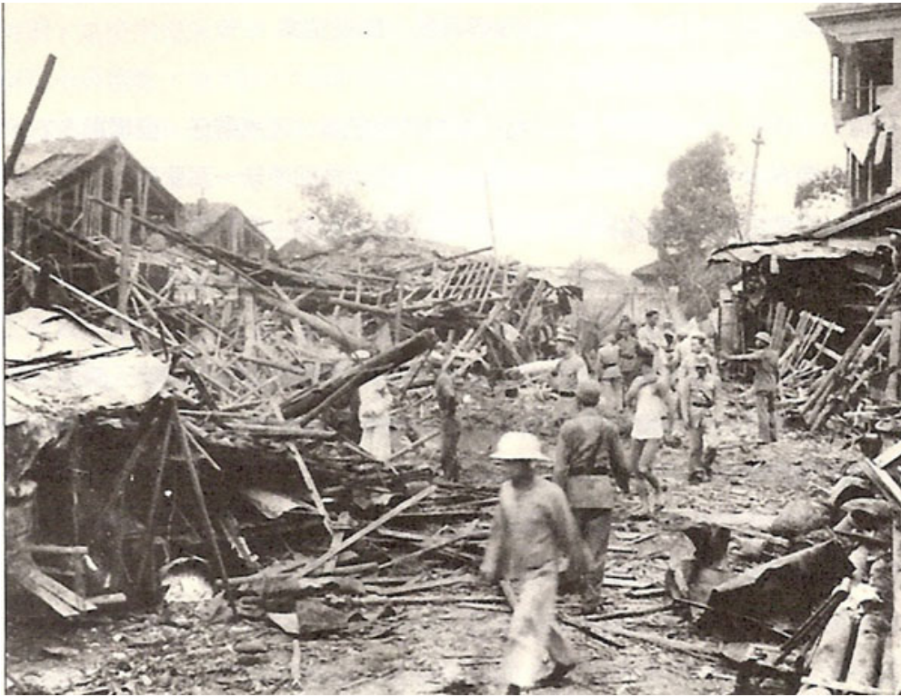
1938 年廣州多次受到日軍空襲，造成嚴重破壞。