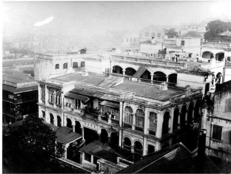
20 世紀初的東華醫院。

易令人迷失方向，不得其解。爲了弄清楚此種特殊的意義，本章先說明東華醫院的傳統紐帶，接著再論述它與香港初期殖民管治的危機及解決之道，以後的篇幅才談論它成立的種種過程。