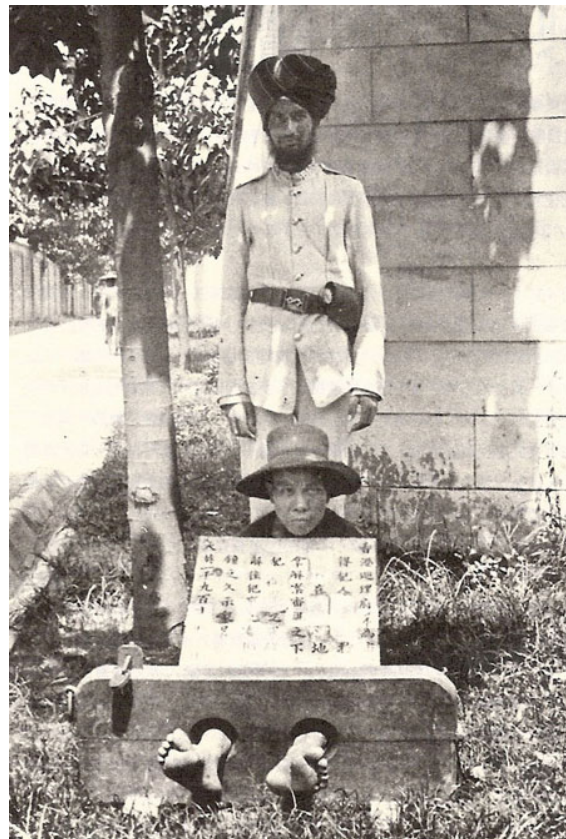
一名被判以擔枷示眾的犯人，這種懲罰在英國的法律中原來是沒有的。