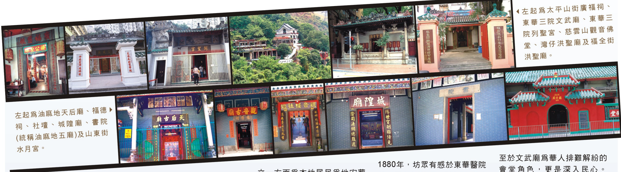
左起為油麻地天后廟、福德祠、社壇、城隍廟、書院(統稱油麻地五廟)及山東街水月宮。