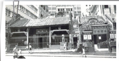
建成於1847年的文武廟。

至於文武廟為華人排難解紛的會堂角色，更是深入人心。1910年的「華字日報」有如下報導：「有一宗竊磚案，兩造之供詞甚堅。後商定以斬雞頭為誓，法官遂派洋警及華警各一往廟堂監視原告及被告誓願。再提訊時，華警供曰被告於斬雞頭時，即自誓如所言不實，有如此雞而死。原告亦斬一雞頭，但無言語。最後，法官判被告得直。」至東華醫院落成以後，文武廟華人議事堂