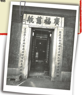
1895年義祠重建後的門額。

東華確立了慈善與廟宇管理的關係，把廟宇的收益轉化為改善民生的醫療、教育及慈善服務。現在讓我們一起探索多間廟宇與東華三院的淵源吧！