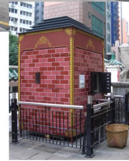
位於荷李活道的文武廟及清煙環保爐。