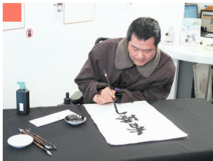
▲「i-dArt愛不同藝術」為弱能人士策劃不同主題的展覽及共融藝術工作坊。▲