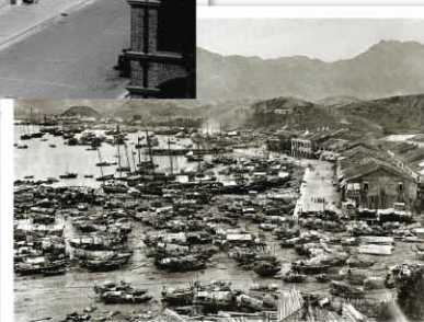
油麻地（約攝於1880年），右方街道為現時的新填地街。