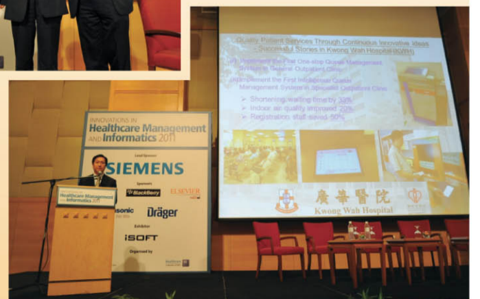
於馬來西亞吉隆坡舉行的「創新醫療管理及信息會議2011」與海外專家分享團隊推行智能登記系統的經驗。