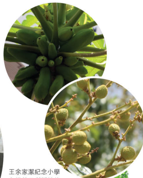
王余家潔紀念小學有機菜田所種植的木瓜及龍眼。