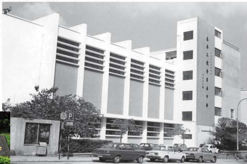
1961年落成的東華三院黃笏南中學，是東華三院的第一間中學。