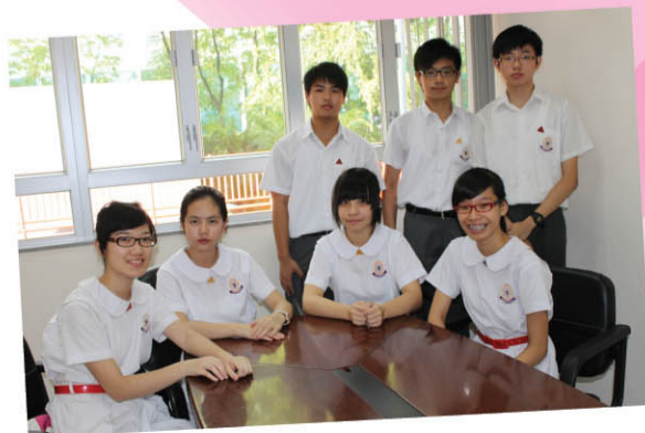
東華三院甲寅年總理中學學生。