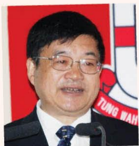
中國針灸學會副會長兼秘書長、 中國中醫科學院副院長劉保延教授