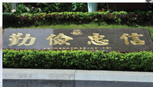
東華三院黃笏南中學首屆(1965年畢業)校友為紀念母校所授校訓，特送贈刻上校訓的啡麻石匾予母校，寄意東華學子能秉持「勤儉忠信」的校訓。