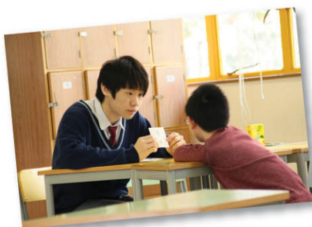
東華三院黃鳳翎中學推行「親子識字特攻隊」的活動情況。

評審團認為東華三院黃鳳翎中學「親子識字特攻隊」活動的創意及成效俱備，同學積極參與其中，充份展現關懷社區的領袖精神。