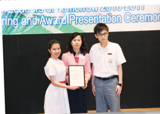
東華三院黃鳳翎中學獲教育局陳美寶副秘書長(中)頒發優秀社會服務獎。