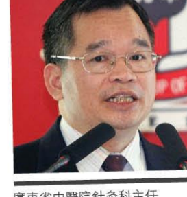
廣東省中醫院針灸科主任 符文彬教授