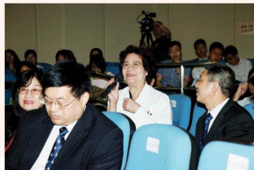
東華三院中醫師與中國針灸學會人員在針灸應用培訓班暨座談會中互相交流。