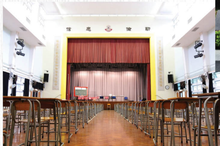
禮堂兩側刻有唐隸「聞弦歌之聲當思愛眾親仁敦詩說禮 謹庠序之教尤在致知格物博古通今」楹聯，寄意該校師生秉持傳統學教態度，化雨春風。