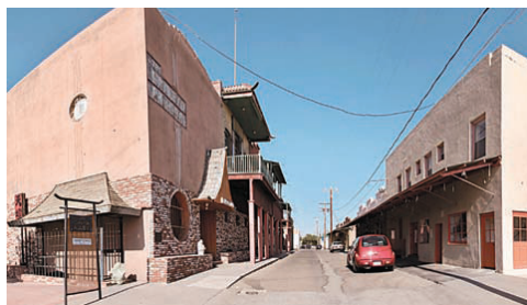
■Handford唐人街為修鐵路華工聚集點，曾經聞名一時。