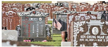
■三藩市較新的華人公墓——金山陵園，是現在不少華人將先人遺骨安葬之地，實行「落地生根」。

東華義莊制度作為十九世紀末出現的特殊文化現象，它對慈善募捐、海外華工的組織管理以及海外與中國的聯繫等方面的設定，充分反映了中國人的智慧和同族之間同聲同氣的傳統遵循。而推動這種遵循的，其實是更古老的「落葉歸根」的情懷。