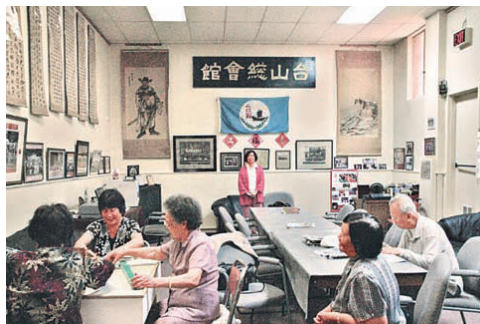
■加拿大域多利台山總會館現址。