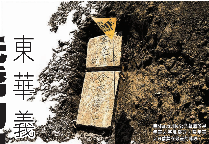
■Marysville公共墓園的早年華人墓堆部分，當年華人只能葬在最差的地段。

氏組織。另外一種是工所，是以行業劃分，讓每人有所歸屬。」而以地緣性組織起來的會館最為普遍，這也有利於同鄉身後運回家鄉。然而，為何一定要強調「原籍安葬」？