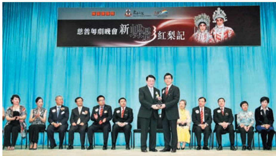
▲ 梁定宇主席(右)致送紀念品予衛生署林秉恩署長。