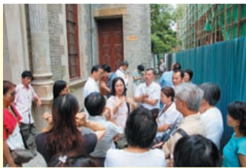
▲ 2007年9月，義工團隊到廣東開平參觀碉樓及了解東華原籍安葬的歷史。