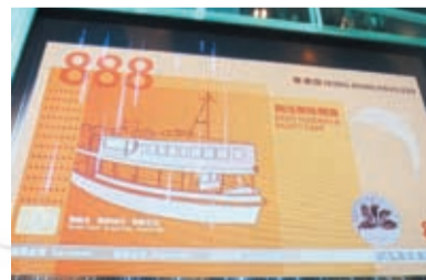
▲ 同學發揮創意，於香港館內親自設計十元鈔票。