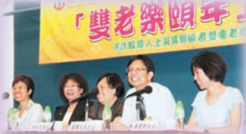
▲研討會環節討論到智障人士面對其照顧者或自己的生死問題，參加者熱烈表達意見及向嘉賓提出發問。