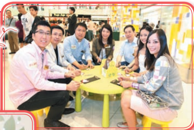
▲一眾董事局成員參與「傳心·傳愛」留言行動。