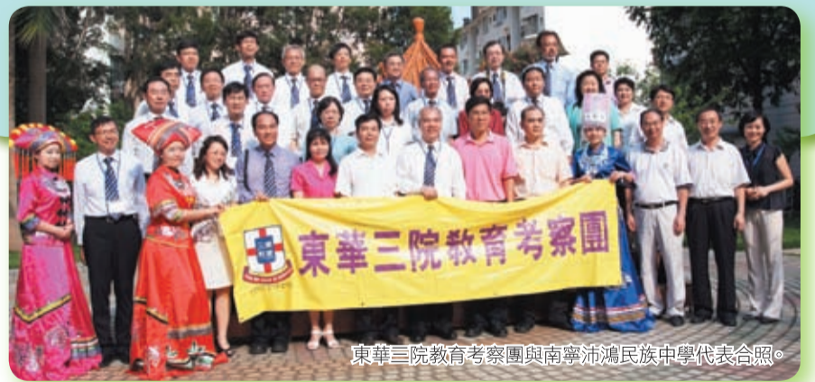
東華三院教育考察團與南寧沛鴻民族中學代表合照。

考察團更參觀了位於南寧高科技區的培力(香港)健康產品有限公司，一睹廠房現代化的製藥過程和嚴謹的品質檢定程序，眼界大開。