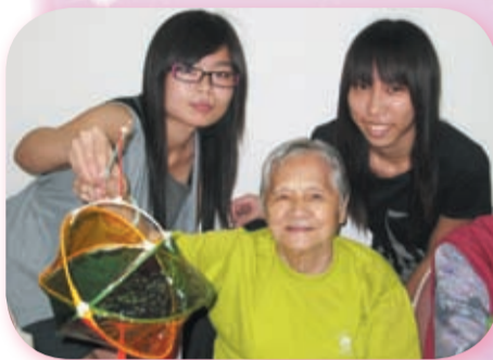
◀ 通過不同形式的小組活動，耆緣大使及長者院友跨越年齡的界限，建立友情。

有人說，年青人自我，不懂關心別人。 又有人說，年青人封閉，不會與人分享。 還有人說，年青人幼稚，甚麼也依賴別人。 但，只要有一道橋樑，讓他們踏上，讓他們與別人連繫，他們的愛和關心， 便會發放出來，思想會變得成熟，人生會過得更有意義， 這便是「愛」的橋樑。