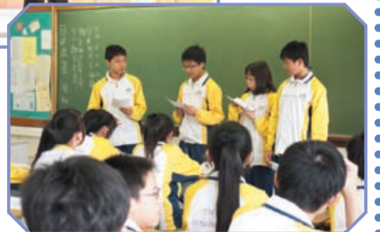
▲ 學生進行短講時必需具備論點、論據和說明三項要素。

行政長官卓越教學獎於2003年起舉辦，每年就不同學習領域選出教學卓越的教師，藉以推廣及分享優良的教學實踐。本年度評審團從一百三十三份提名當中，選出十份(共二十九位教師)頒授「中國語文教育」或「英國語文教育」卓越教學獎。