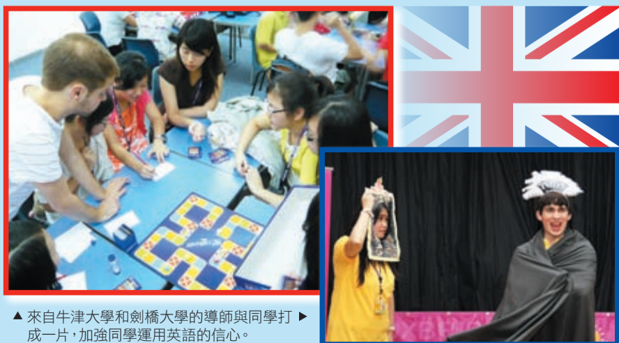
▲來自牛津大學和劍橋大學的導師與同學打成一片，加強同學運用英語的信心。

心血管病是香港的第二號殺手，高膽固醇飲食、不良生活習慣、肥胖、吸煙及壓力等均為導致港人心血管病發病率急劇上升的因素，而且患者更出現年輕化的趨勢，情況令人憂慮。