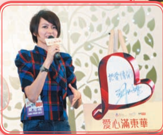
◀「東華愛心之星」梁詠琪將「把愛傳開」的心願寄語東華三院。