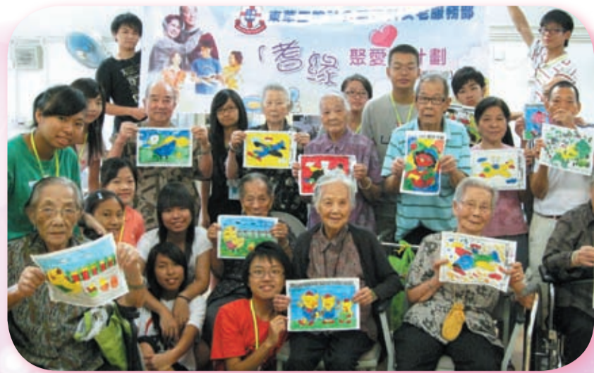
▲ 友誼相伴，人生猶如一幅圖畫，色彩繽紛豐富。