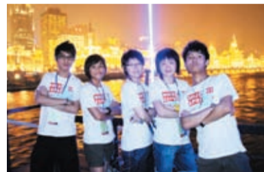
▲ 同學們夜遊黃浦江，感受浦東及浦西的不同景色。

透過是次學習團，同學不但擴闊視野、培養對祖國經濟、社會及文化的認識，更提升對國民身份的認同。