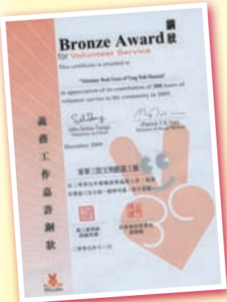
▲ 東華三院文物館義工於2009年獲香港社會福利署頒發義務工作嘉許銅狀，成績令人鼓舞。

為了令數碼化過程對檔案的影響減至最低，文物館於計劃正式開展前邀得原香港歷史博物館總館長丁新豹博士、康樂及文化事務署總館長（文物修復）陳承緯先生、嶺南大學香港與華南歷史研究部主任劉智鵬博士等各方專家提供寶貴意見。由於館藏檔案浩如煙海，文物