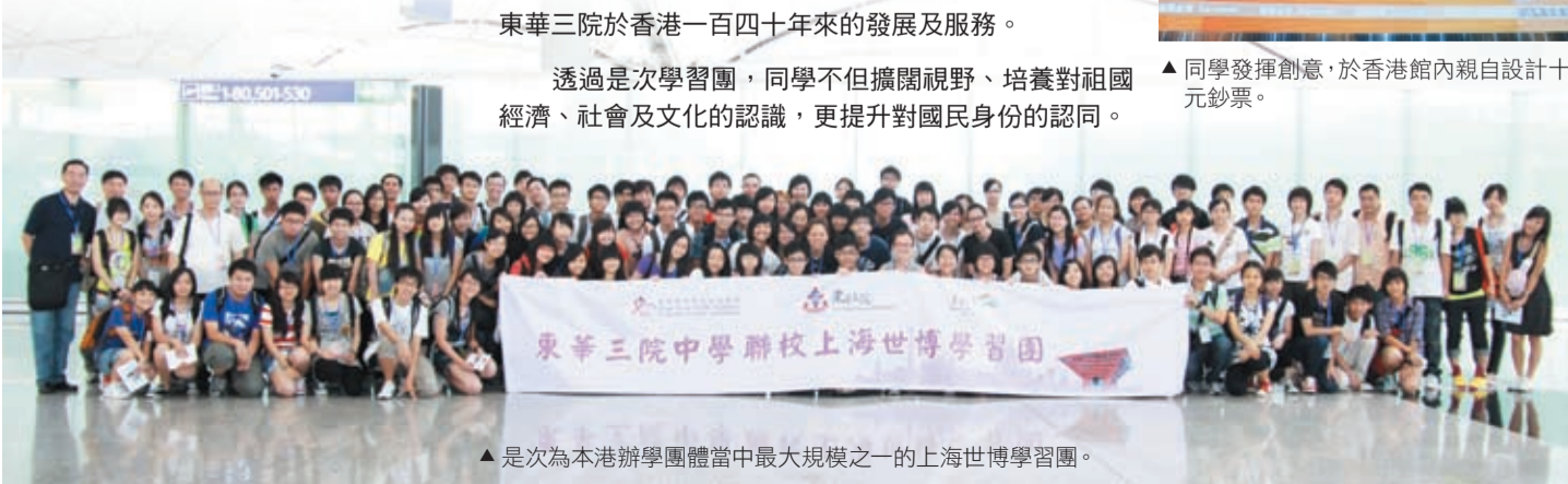
▲ 是次為本港辦學團體當中最大規模之一的上海世博學習團。