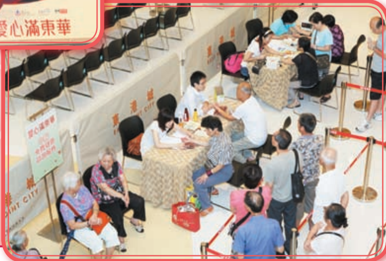
現場中西醫免費健康諮詢服務攤位大受市民歡迎。