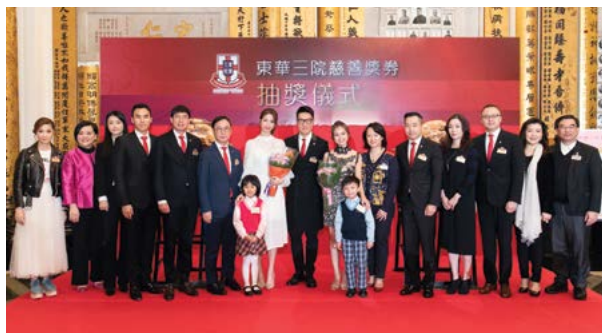
董事局成員與2018年度香港小姐合照 Group photo of Board Members with winners of Miss Hong Kong Pageant 2018