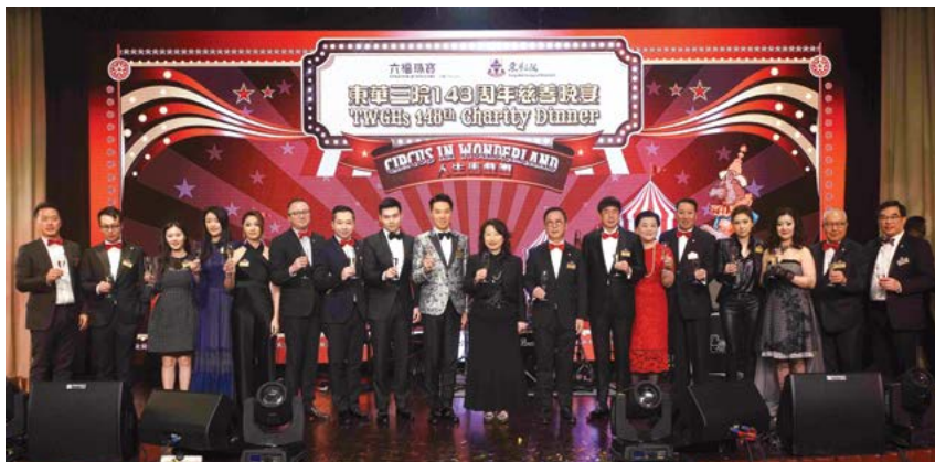
律政司司長鄭若驊GBS, SC太平紳士（右九）與董事局成員主持祝酒儀式。 The Hon. CHENG Yuek Wah, Teresa, GBS, SC, JP (right 9), The Secretary for Justice, and Board Members officiated at the Toasting Ceremony.