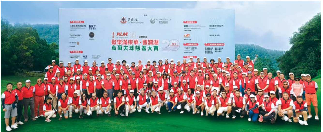
一眾嘉賓於比賽前合照 Group photo of the players before the Tournament

Kam Lung Motor Group 35th Anniversary proudly sponsors: Tung Wah Charity Gala – Charity Golf Tournament at Mission Hills Golf Club was held at Mission Hill Golf Club in Dongguan, China on 26 and 27 October 2018. First introduced in 1999, the Tournament marks its twentieth anniversary this year. More than 200 guests took part in the Tournament to raise funds for our “Endless Care Services”, which provides one-stop services for the elderly to age gracefully and lead a truly fulfilling life.