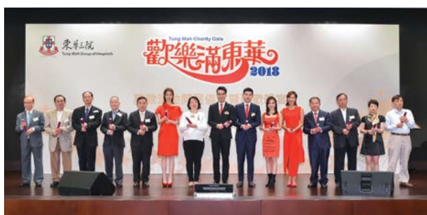
一眾嘉賓主持「歡樂滿東華」籌款活動開展儀式暨聯歡晚宴開展禮。 Guests officiated at the Kick-off Ceremony of the "Tung Wah Charity Gala" cum Dinner Reception.