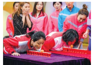
晚會邀得多位歌影視紅星及粵劇名伶參與演出。 Artistes, Cantonese opera masters and celebrities, enthusiastically performed in support of the charity.