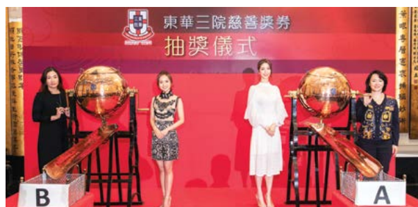
女董事局成員、董事局成員夫人及香港小姐主持慈善獎券攪珠儀式。 Female Board Members, spouses of Board Members and winners of Miss Hong Kong Pageant 2018 conducted the charity raffle draw.

The charity raffle tickets were sold at TWGHs' service centres and supporting corporations from January to March 2019 to raise funds for the “TWGHs Development Fund of Kwong Wah Hospital Redevelopment Project”. A raffle draw was conducted by female TWGHs Board Members, spouses of Board Members and winners of Miss Hong Kong Pageant 2018 at the Assembly Hall of TWGHs Li Shiu Chung Memorial Building on 8 March 2019.