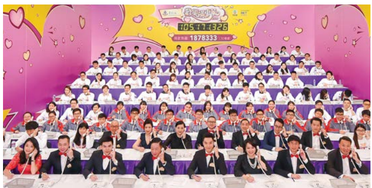
董事局成員親力親為，在熱線中心擔任義工接聽捐款電話。 Board members volunteered to help taking phone calls in the donation hotline centre.