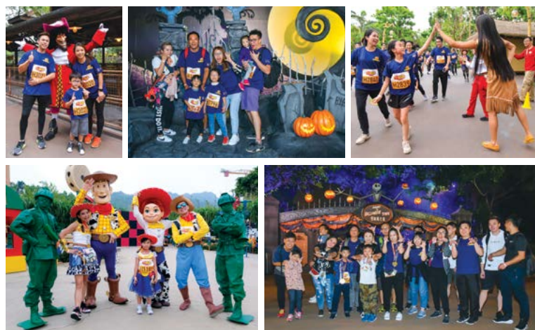
參加者與沿途打氣的迪士尼朋友合照，完成賽事後更留在樂園參加萬聖節尊享活動。 Apart from taking pictures with Disney Characters along the route, participating families had a great time enjoying exclusive Halloween activities after the Run.