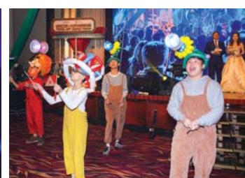
晚宴匯聚各項雜技、小丑、魔術及歌舞表演。 An array of sensational and edge-of-your-seat circus acts presented during the Dinner.