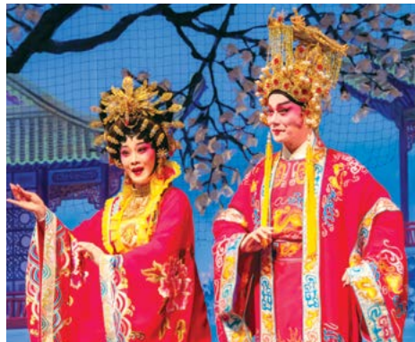
廣東粵劇院一團的演出聲色俱備，教人目不暇給，觀眾掌聲不絕。 The spectacular performance of Guangdong Cantonese Opera Theatre has won thunderous applause.