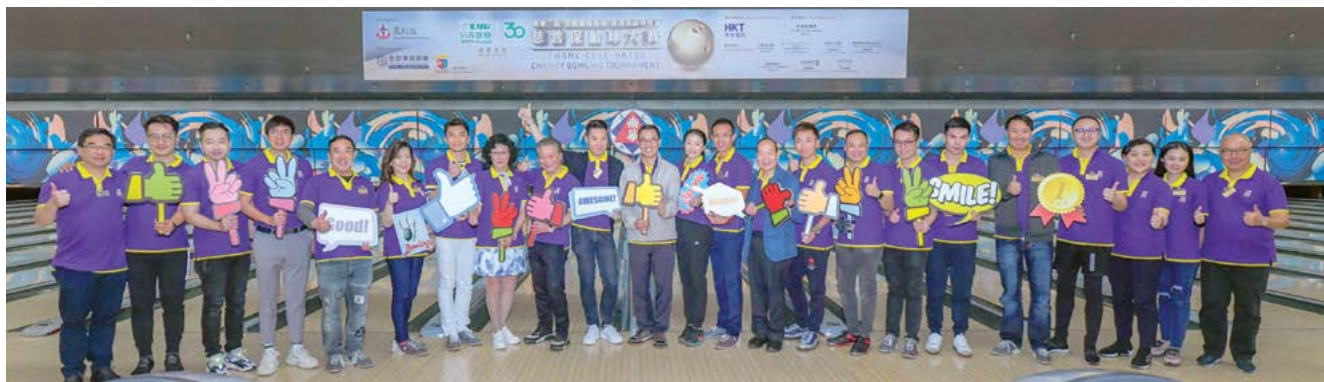
董事局成員及一眾嘉賓為慈善出一分力。 Board Members and guests joined hands for charity.