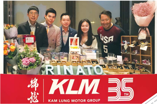
董事局成員合照 Group photo of Board Members

"Kam Lung Motor Group 35th Anniversary Charity Dinner" was held at The Ritz-Carlton, Hong Kong on 18 May 2018. TWGHS was invited to be the beneficiary organisation of the Charity Dinner, and a total of $707,000 was raised from auction in support of the Group's "Endless Care Services".