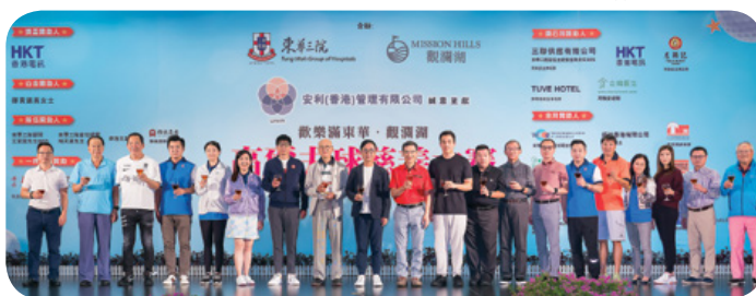
董事局成員、歷屆全人及主禮嘉賓一同祝酒。 Board Members, former Board Members and the Guest of Honour toasted at the Event.