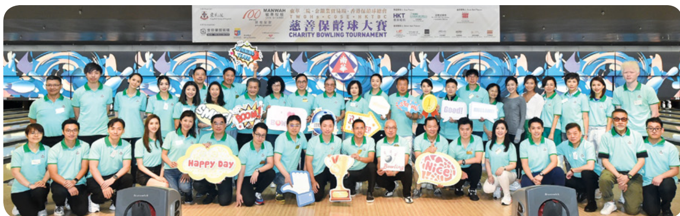
董事局成員及一眾嘉賓為慈善出一分力。 Board Members and guests joined hands for charity.