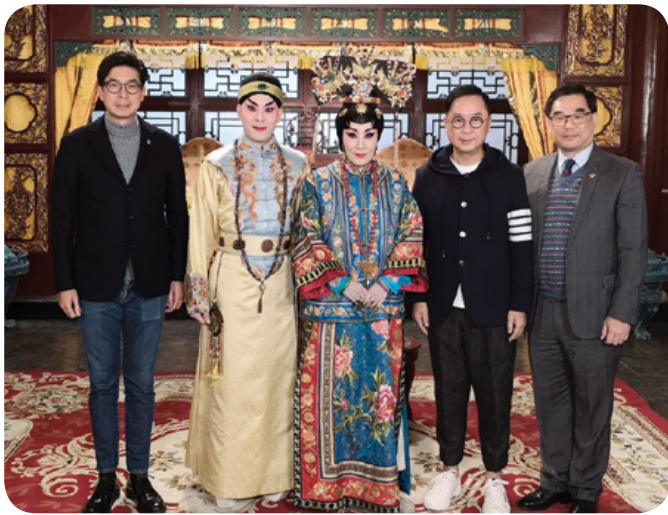
晚會邀得多位歌影視紅星及粵劇名伶參與演出。 Artistes, Cantonese opera masters and celebrities, enthusiastically performed in support of the charity.