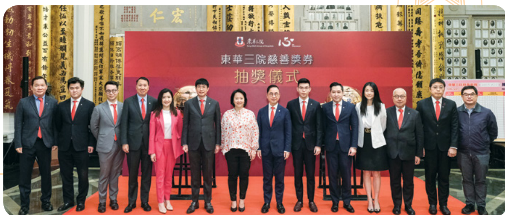
董事局成員合照 Group photo of Board Members