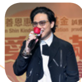
「愛心之星」蘇永康先生於晚會上獻唱多首經典名曲。Singing performance was made by Mr. William SO, the “Caring Star” of the Scheme, at the Dinner Show.