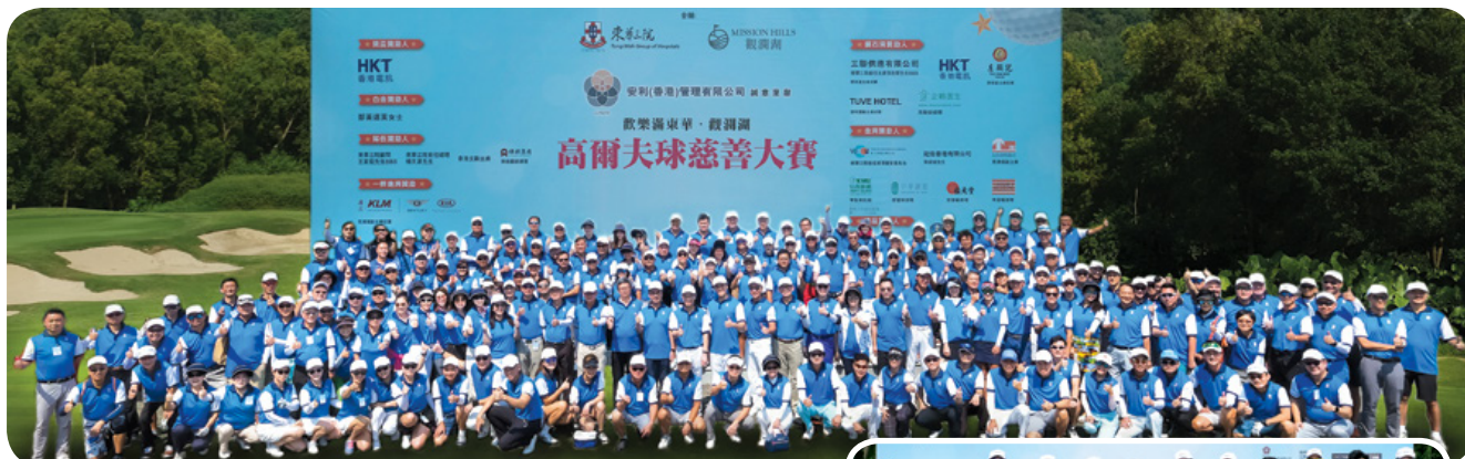
一眾嘉賓於比賽前合照 Group photo of the players before the Tournament