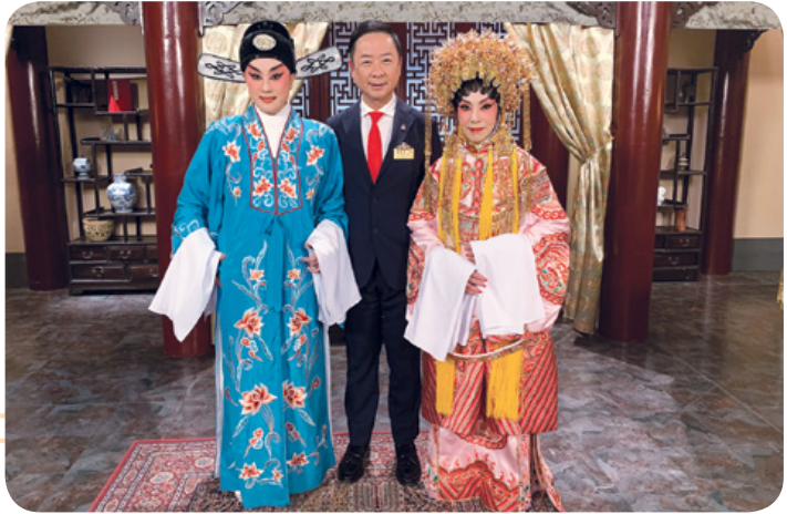
晚會邀得多位歌影視紅星及粵劇名伶參與演出。 Artistes, Cantonese opera masters and celebrities, enthusiastically performed in support of the charity.