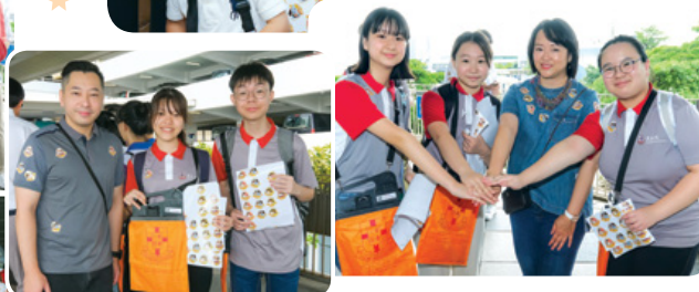
董事局成員到各區親身呼籲市民支持及為義工打氣。 Board Members visited various districts to call for public support and cheer on the volunteers.