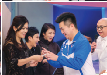
董事局成員落力參與遊戲項目。 Board Members participated vigorously in games.