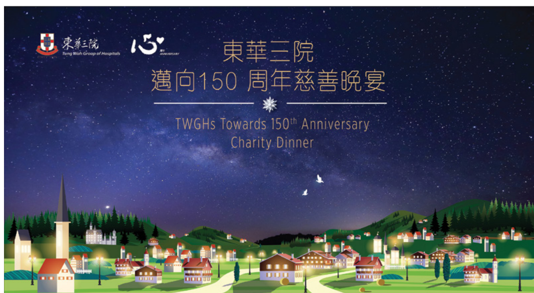
晚宴以「溫暖初春」作佈置 The Dinner was decorated with the theme of “Warm Spring”

“TWGHs Towards 150th Anniversary Charity Dinner” was held at the Grand Ballroom of Rosewood Hong Kong on 30 March 2020 to raise funds for TWGHs Development Fund of the Kwong Wah Hospital Redevelopment Project to enhance medical facilities and services. The Dinner was decorated with the theme of “Warm Spring”, symbolising TWGHs services brought warmth to the needy in time. A number of singers and artistes enlivened the Dinner with their enchanting voices and performances. Given that 2020 is the year for TWGHs to celebrate its 150th anniversary, a series of celebration events were kick started at the Dinner, as the Group moved forward to a new milestone of 150 years in the witness of our guests.