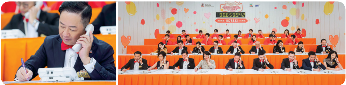
董事局成員親力親為，在熱線中心擔任義工接聽捐款電話。 Board Members volunteered to help talking phone calls at the donation hotline centre.