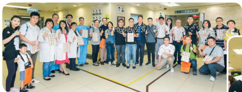
董事局成員到訪廣華醫院，為賣旗的醫護義工打氣。 Board Members visited Kwong Wah Hospital to show their support to medical staff volunteering in flag selling.